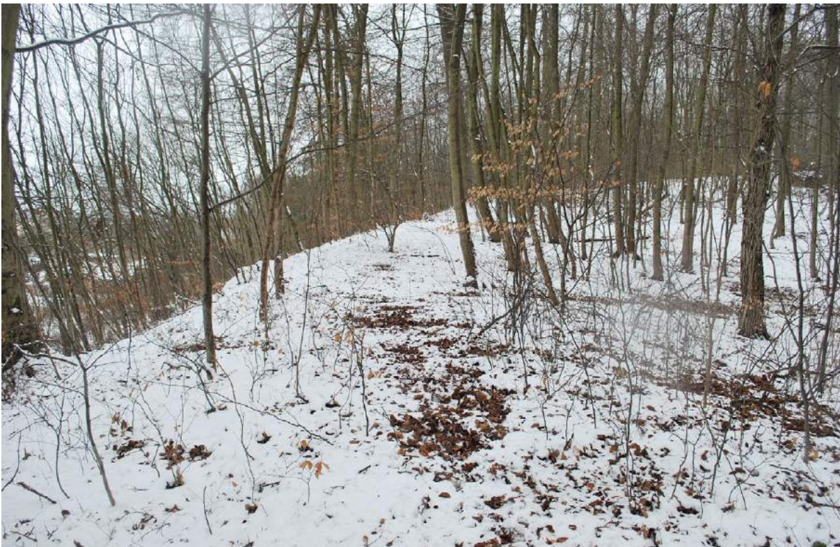
Abbildung 8 Versturz der Burgmauer 2014, Innenfläche der Burg

Burg möglich und ein Kaiseraufenthalt belegt. 1227 belagerte Heinrich Raspe IV. die Burg und eroberte sie. Danach wurde sie Lehen der Herren von Vippach, scheint aber an Bedeutung verloren zu haben ( Timpel/Grimm 1975, 25, 80; Wenzel 1999, 56 ).