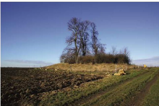
Abbildung 1 Zustand des Bärenhügels 2015 von Südosten