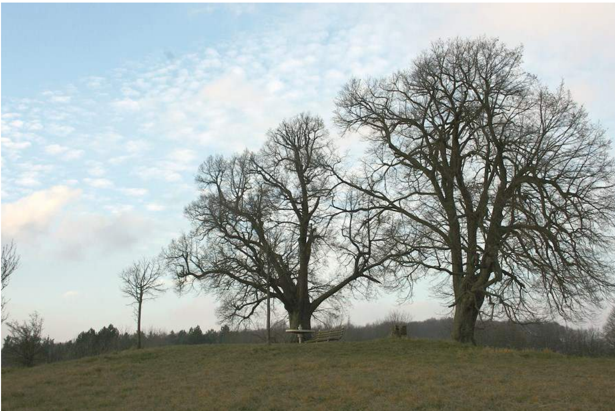
Abbildung 2 Blick von Südost auf die „Napoleonslinden“

Der Hügel liegt weit sichtbar auf der Höhe der Finne, heute von einer kleinen Baumgruppe markiert, den Napoleonslinden. Bei gutem Wetter besteht Sichtverbindung zum „Bärenhügel“ bei Wohlsborn auf dem Kleinen Ettersberg (vgl. Nr. 21). Der Einzelhügel über Auerstedt wurde wahrscheinlich bereits in früherer Zeit unwissenschaftlich untersucht, wovon die Einsenkung in der Hügelmitte zeugt. Die dabei sicher gemachten Funde sind heute verloren. Der Volksmund berichtet, dass der Hügel das Grab eines französischen Offiziers birgt. Eine andere Erzählung behauptet, dass Napoleon von hier die Auerstedter Schlacht beobachtet habe. Letzteres ist nicht möglich, da er die Doppelschlacht 1806 von Cospeda und von Vierzehnheiligen ausleitete (Archiv TLDA, OAWeimar).