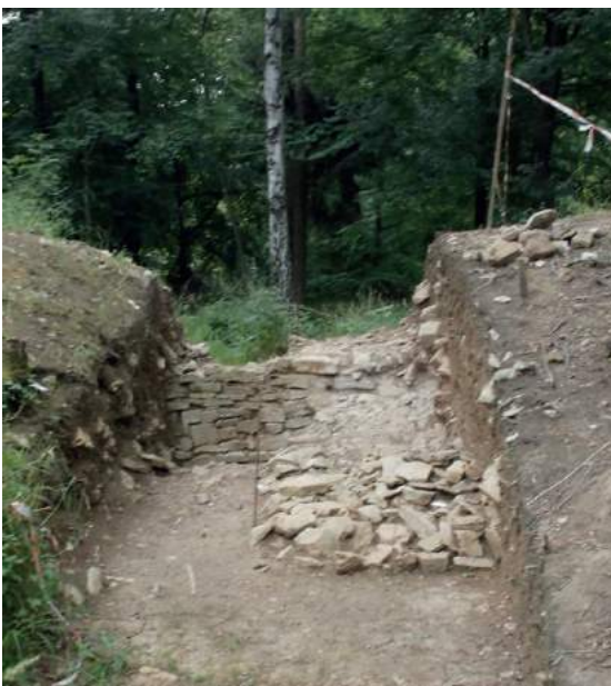
Abbildung 7 Gleicher Wallschnitt mit Trockenmauerwerk, Grabung 2013