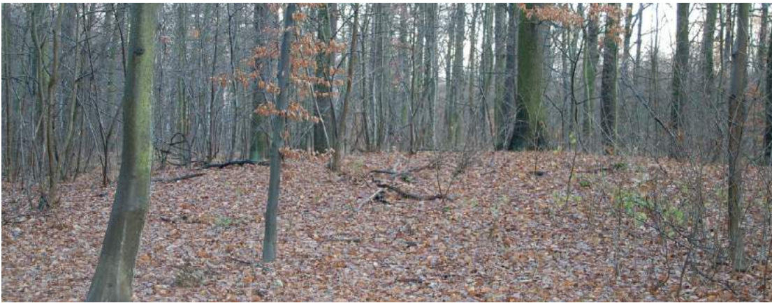
Abbildung 4 Der Grabhügel im Traubeneichenreservat