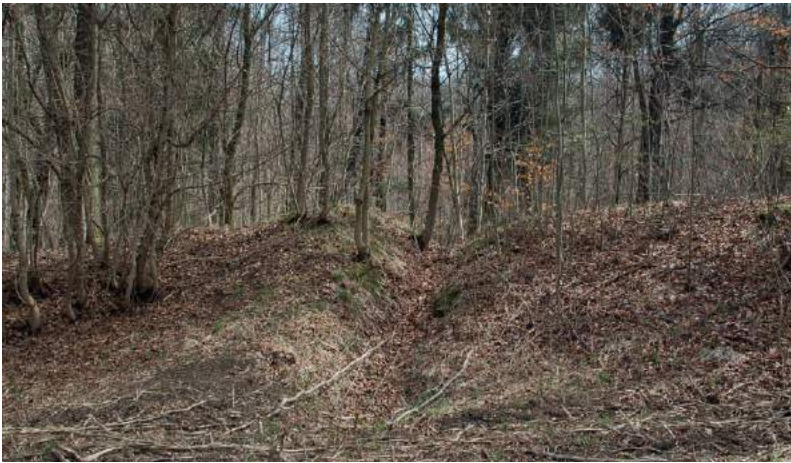
Abbildung 6 Verfallener Wallschnitt Kustos Möller, erste Hälfte 20. Jh.

Die Befestigungsanlage besteht aus einem im Grundriss geschlossenen, ovalen Ringwall. Der Wall hat eine Gesamtlänge von etwa 600 m und umschließt eine Innenfläche von 90 × 180 m. Spuren einer Innenbebauung sind nicht erkennbar. Die Befestigung besteht aus einer umlaufenden massiven Mauer aus örtlichem Muschelkalk. Zwischen zwei trocken gesetzte Mauerschalen wurden Lehm und Bruchsteine gefüllt. Vor der Mauer lag ein einfacher, an manchen Stellen doppelter Graben. Auch innenbegleitet ein Graben die Ringmauer. Die Befestigung entspricht einer frühmittelalterlichen Datierung, für die auch einige Keramikscherben sprechen. Eine erneut freigelegte Mauer zeigt im Versturz nach innen starke Brandspuren. Möglich wäre, in der Wallanlage eine jener Burgen zu sehen, die nach Heinrichs I. Burgenverordnung aus dem Jahr 926 errichtet wurden ( Timpel/Grimm 1975, 19, 74 ).